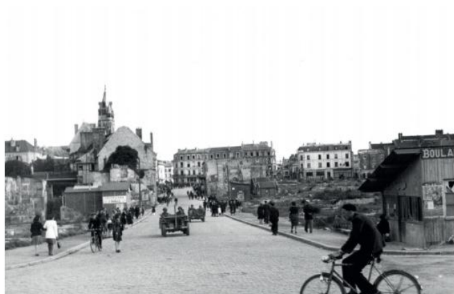
44 - Passage de jeeps dans la rue Solférino