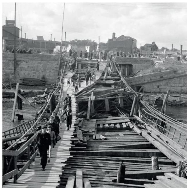
45 - Passerelle de fortune aménagée sur les débris du pont détruit par les Allemands. Au milieu des civils se trouvent des FFI avec des bicyclettes et des fusils. Archives de Compiègne, S2/C03831, photographie André-Louis Guillaume